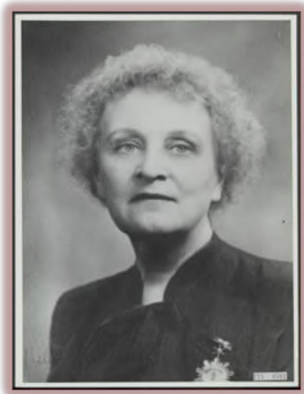
Helen Parkhurst (1886-1973)

Het Daltononderwijs bewijst al honderd jaar lang haar waarde. De onderwijsvorm is gebaseerd op de ideeën van de Amerikaanse pedagoge Helen Parkhurst. Haar ideeën over individuele en niet klassikale ontplooiing van kinderen baseerde zij op haar ervaring als leerkracht.